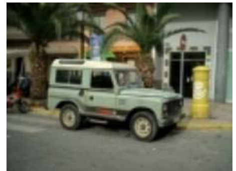
Esto es un 88' turbo, uno de los vehículos de los que podemos obtener un montón de piezas, ya que lleva dirección asistida, ballestas parabólicas, caja de cambios de 5 velocidades, servofreno, puertas de una pieza y techo de fibra'