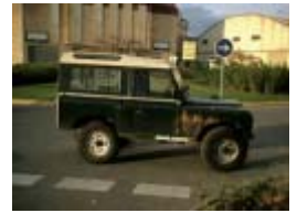
En esta foto vemos un Santana Serie III 88'.